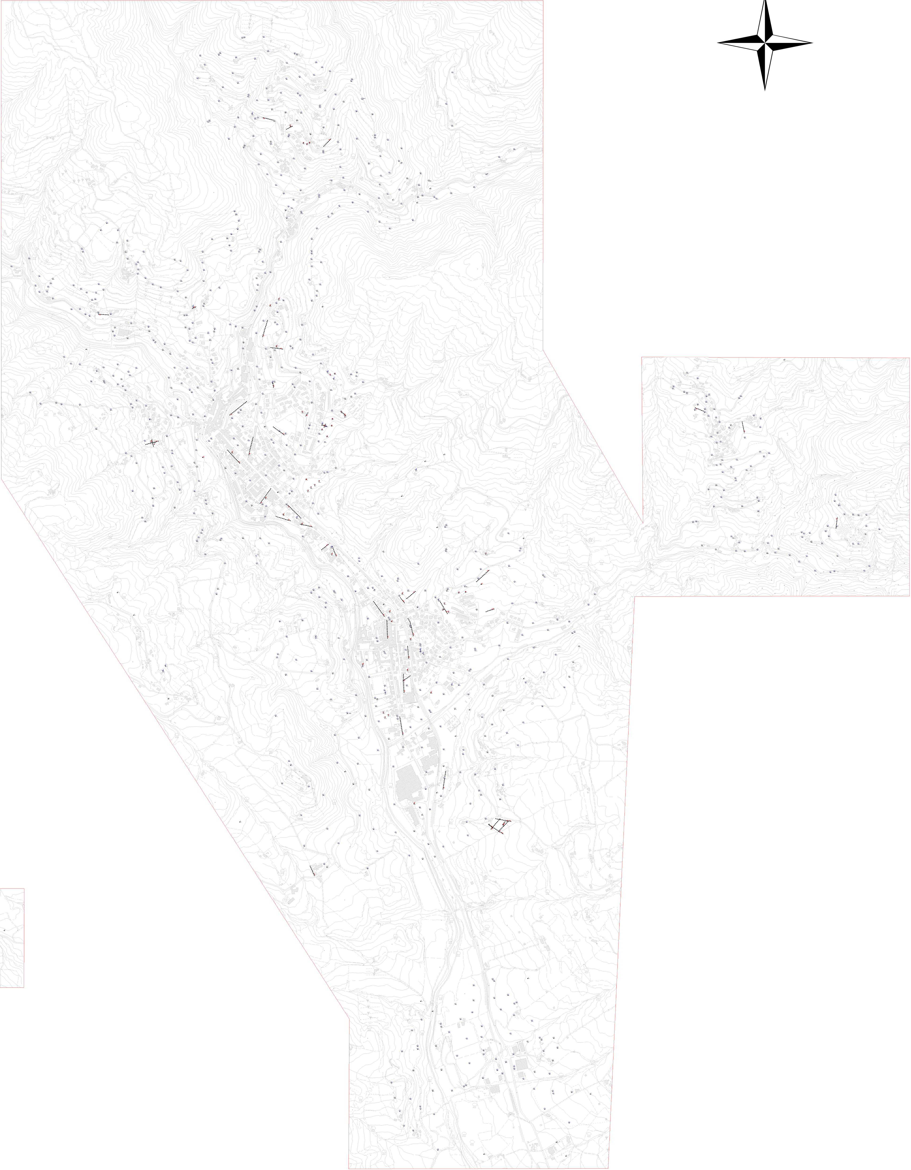
PRATOVECCHIO - STIA - PAPIANO - CASALINO - LONNANO